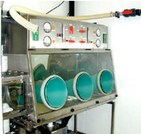
ISOLATEUR INDUSTRIEL CLASSE III