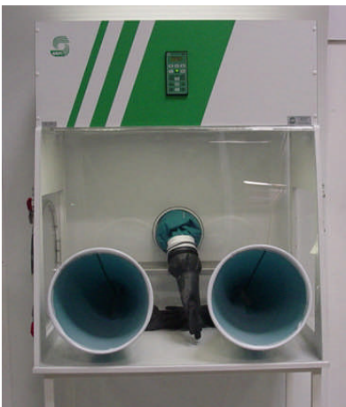
Boîte à gant