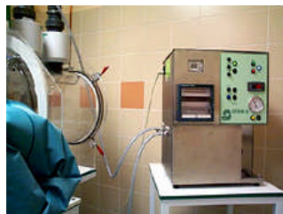
Stérilisateur Acide Paracétique