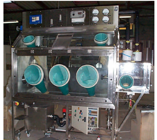
PRÉPARATION DE POUDRES